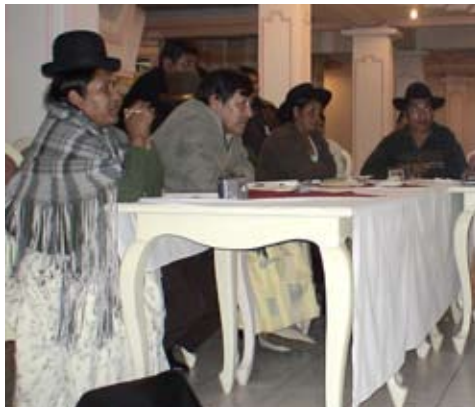
Presentación informe Unión Gral Trabajadores Arte y Cultura 2007

(III Plan Director de la Cooperación Española 2009-2012)