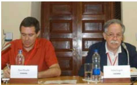
“Seminario la comunicación en la cultura: el reto de los nuevos públicos” Cartagena de Indias Colombia 2008

“El arte, la cultura y las actividades relacionadas con ellas deben ser contempladas no sólo como un recurso social o como un instrumento de gobierno, sino también como el capital humano potencial o real de los individuos. Influyen en la capacidad de la gente para afrontar los retos de la vida cotidiana y para reaccionar ante los cambios repentinos en su ambiente físico y social”